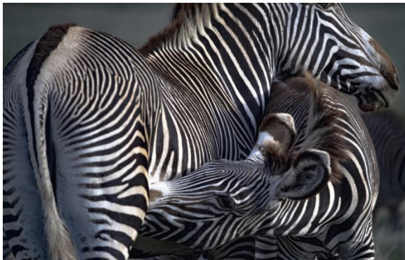
Zebromutter mit Jungtier

4. Tag Lake Nakuru Nationalpark Weitere Pirschfahrten im Park und dazwischen Erholung in der Sarova Lion Hill Lodge.