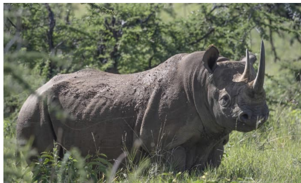
Nashorn im Lewa Wildlife Conservancy

5. Tag Lake Nakuru-Nationalpark – Lewa Wir verlassen den Park in Richtung Lewa. Diese abwechslungsreiche Autofahrt dauert etwa fünf Stunden. Wir überqueren den Äquator im nördlichen Kenia und beziehen für drei Nächte unsere Unterkunft im komfortablen Lewa Safari Camp im Südosten des Laikipia Plateaus. Das private Wildschutzgebiet bietet ein «Out of Africa»-Feeling par excellence. Sanft geschwungene Hügel mit weiten Ebenen, malerische Schirmakazien und der Blick auf das mächtige Mount Kenya Gebirge bilden eine fantastische Kulisse.