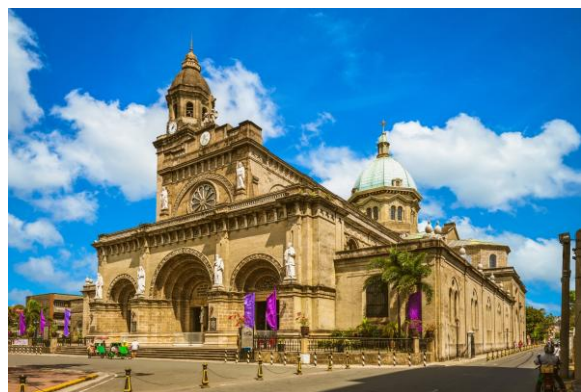
Kathedrale von Manila