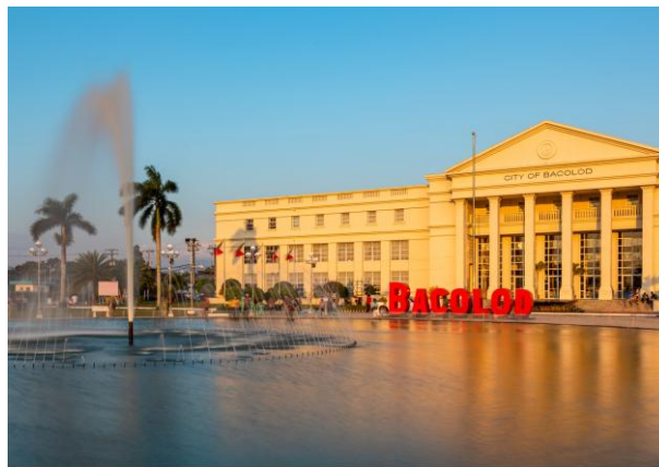
Neues Regierungszentrum in Bacolod