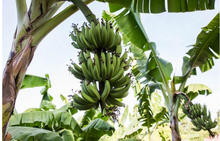
Hieroglyphentreppe in der Maya-Stätte Copán Bananen gehören zu den wichtigen Exportprodukten Guatemalas