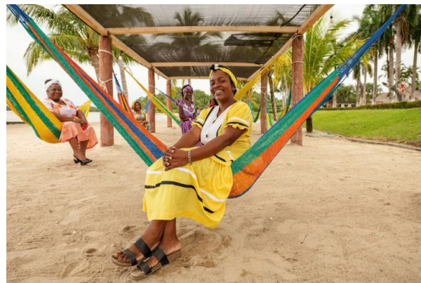
Frauen der Garífuna-Gemeinschaft