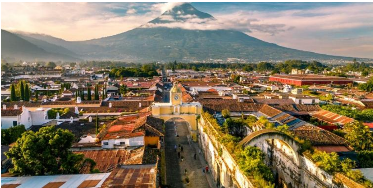
Die koloniale Altstadt von Antigua vor der imposanten Kulisse des Volcán de Agua

Heute entdecken wir Antigua zu Fuss. Die ehemalige Kolonialhauptstadt gehört zu den schönsten Städten Lateinamerikas. Kopfsteinpflaster, blumengeschmückte Innenhöfe und barocke Kirchen prägen das Stadtbild. Während unseres Rundgangs hören wir Geschichten über Erdbeben, Klöster und die spanische Kolonialzeit. Wir schlendern über lebhaftige Plätze, durch kleine Gassen und geniessen immer wieder den Blick auf die umliegenden Vulkane. Der Nachmittag steht zur freien Verfügung.