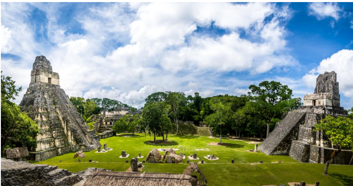
Blick über den grossen Platz von Tikal mit seinen eindrücklichen Tempelpyramiden

Ein weiterer Höhepunkt unserer Reise erwartet uns: Im morgendlichen Licht, das durch das Blätterdach fällt, erkunden wir die monumentale Maya-Metropole Tikal. Gewaltige Tempelpyramiden ragen über den Dschungel hinaus. Wir erfahren mehr über Astronomie, Religion und Machtstrukturen dieser faszinierenden Hochkultur. Brüllaffen, Tukane und die Geräusche des Waldes prägen die besondere Atmosphäre dieses Ortes.