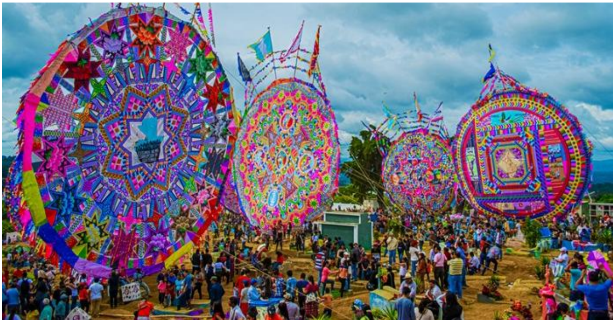
Zu Allerheiligen steigen in Santiago Sacatepéquez riesige Drachen in den Himmel

Frühmorgens fahren wir nach Santiago Sacatepéquez, wo wir einem der eindrücklichsten Kulturereignisse Guatemalas beiwohnen. Das Riesendrachen-Festival zu Allerheiligen hat seine Wurzeln in indigenen Maya-Traditionen und verbindet Spiritualität, Ahnenkult und gemeinschaftliches Kunsthandwerk.