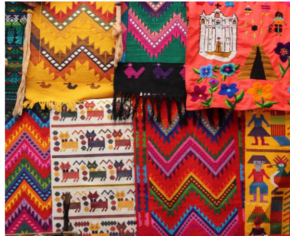
Maya-Textilien mit traditionellen Mustern