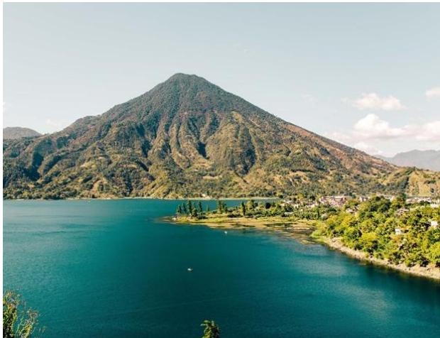
Blick auf den Atitlán-See

Per Boot gleiten wir über den tiefblauen Atitlán-See, umgeben von Vulkanen und traditionellen Dörfern. Unser Ziel ist das Dorf San Juan La Laguna, das für seine lebendige Maya-Kultur bekannt ist. Wir besuchen ein Schokoladenprojekt und eine Weberinnen-Kooperative. Dabei lernen wir alte Webtechniken, Naturfarben und die symbolische Bedeutung der Muster kennen. Jede Farbe und jede Form erzählt eine eigene Geschichte.