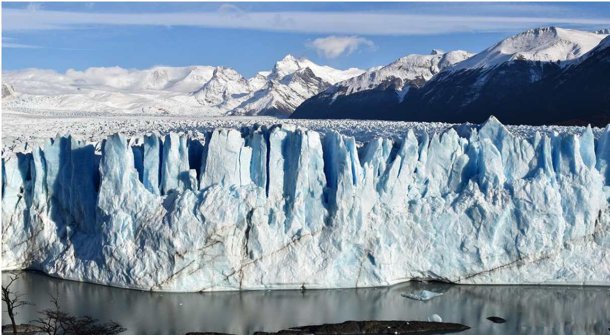
Perito Moreno Gletscher

Heute besichtigen wir den Perito Moreno Gletscher, welcher sich über mehr als 200 km 2 erstreckt. Während einem Spaziergang entlang des Gletscherrandes nehmen wir seine unglaubliche Grösse wahr. Für Abenteuerlustige besteht die Möglichkeit, eine Wanderung auf dem Gletscher mit Steigeisen zu unternehmen (Zahlung vor Ort).