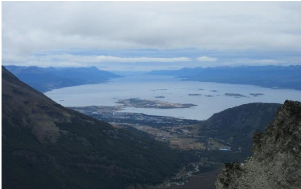
Aussicht auf Ushuaia und den Beagle-Kanal

Ein weiterer Höhepunkt unserer Reise erwartet uns: unsere Expeditionsreise an Bord der «Ventus Australis». Vor der Einschiffung unternehmen wir eine Wanderung im berühmten Nationalpark Tierra del Fuego.