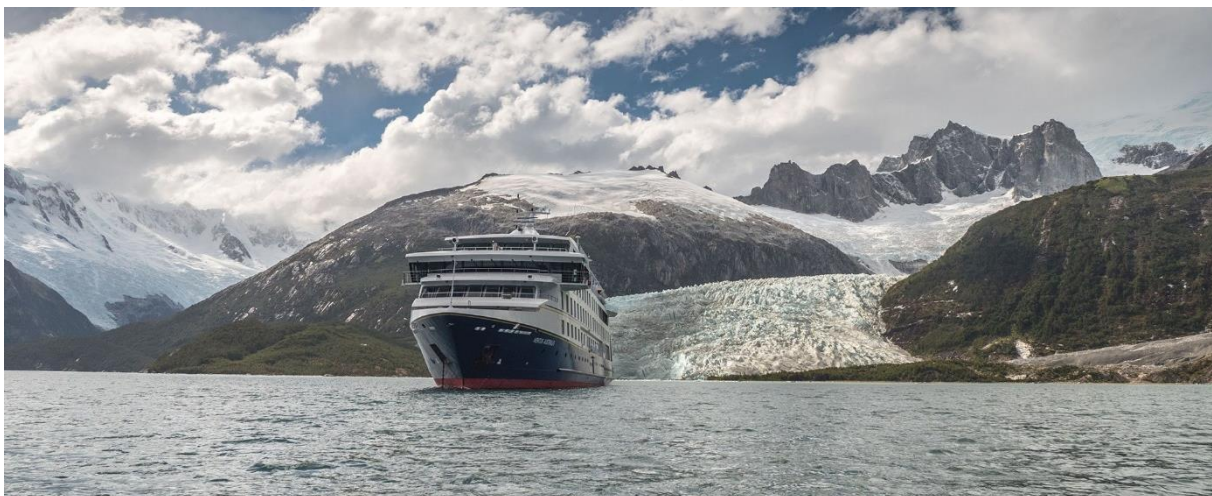
Ventus Australis

Die nächsten Tage verbringen wir an Bord. Wir fahren durch den Beagle-Kanal und die Magellanstrasse, besuchen die Wulaia-Bucht, wo Charles Darwin seine Weltreise startete, und landen bei verschiedenen Gletschern an, an um kleine Wanderungen zu unternehmen. Es erwarten uns eine aussergewöhnliche Tier- und Pflanzenwelt und überwältigende Landschaften. Der Besuch der Insel Magdalena mitten in der Magellanstrasse und die Umfahrung des Kap Hoorns sind weitere Höhenpunkte unserer Schiffsexpedition.