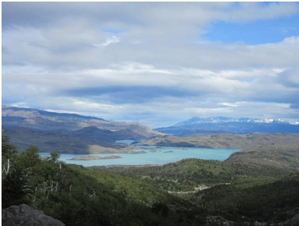
Nationalpark Torres del Paine

Heute erwartet uns ein absoluter Höhepunkt unserer Reise: der unvergleichliche Torres del Paine Nationalpark. Wunderschöne Panoramaaussichten erwarten uns mit steilen Bergspitzen, riesigen Gletscher und tiefblaue Seen. Zu Fuss erreichen wir den Aussichtspunkt am Greysee, der einen wunderbaren Blick auf den Gletscher Grey bietet. Nach der Mittagspause setzen wir die Tour durch die Sektoren Salto Grande und Laguna Amarga fort. Ein letzter Rundblick erwartet uns am Aussichtspunkt des Lago Sarmiento, bevor wir nach Puerto Natales zurückkehren.