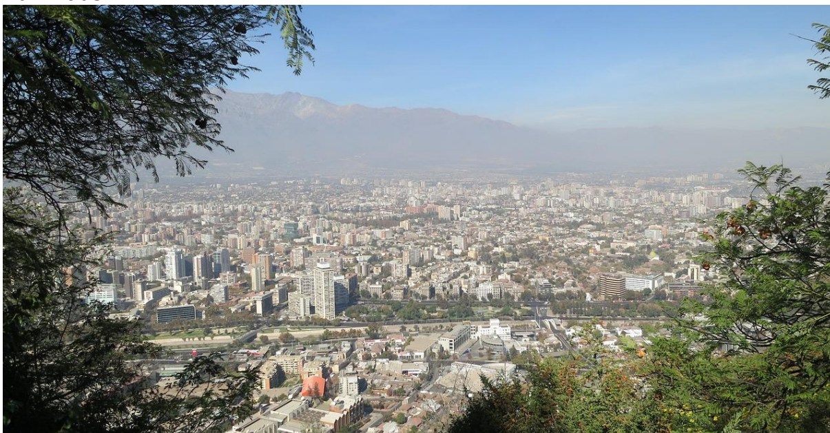
Santiago de Chile

Am letzten Tag sehen wir während einer geführten Tour unter anderem den Regierungspalast La Moneda, die Kirche San Francisco, die Nationalbibliothek und den Hügel Santa Lucia, auf welchem Santiago gegründet wurde. Wir besuchen das Stadtzentrum und den Mercado Central, den Hauptmarkt für Fisch und Meeresfrüchte, wo wir auch das Mittagessen einnehmen. Nach einem Rundgang durch das Künstlerviertel Bellavista fahren wir mit der Gondelbahn zum Cerro San Cristobal. Vom Gipfel aus geniessen wir ein grossartiges Panorama über die Stadt und beobachten, wie sich die Häuser bis zum Andenfuse hinziehen. Danach erfolgt eine Fahrt durch die modernen Wohngebiete Vitacura, Las Condes und durch das geschäftige Einkaufsviertel Providencia. Zum Abschluss geniessen wir einen letzten Rundumblick auf die Grossstadt vom Costanera Center Sky Turm aus.