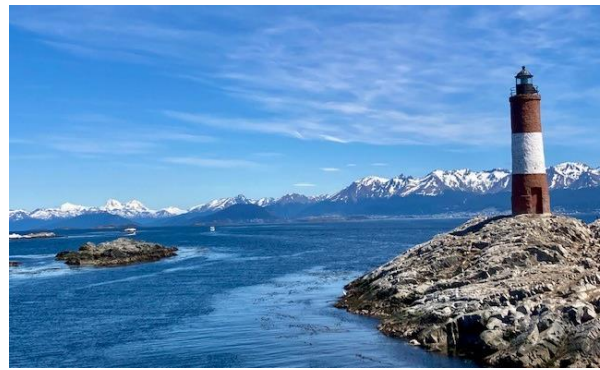
Leuchtturm im Beagle-Kanal