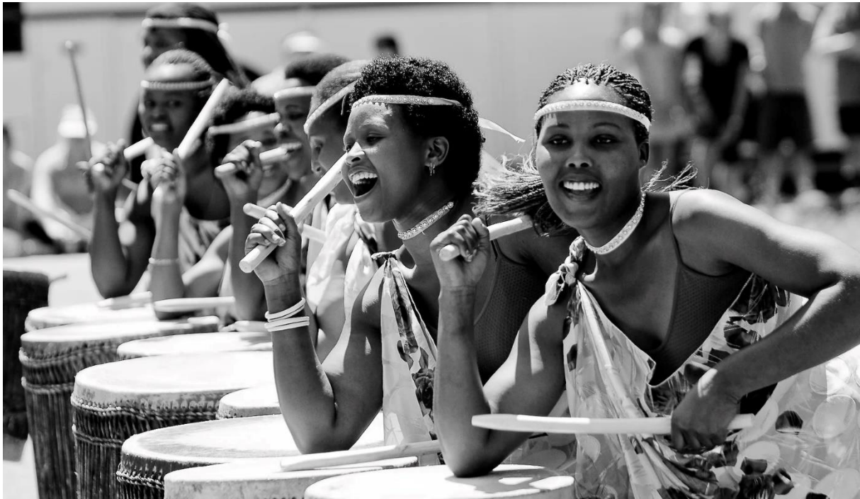
Ingoma Nshya

Sie nehmen Abschied vom Nebelwald und fahren zurück nach Kigali. Auf dem Weg erwartet Sie eine besondere Begegnung mit der «Ingoma Nshya» Trommlerinnengruppe. Früher war es Frauen verboten zu trommeln, und wenn sie es doch taten, brachten sie grosse Schande über ihre Familien. Aber nach dem Völkermord im Jahr 1994 wurde die erste weibliche Trommlergruppe gegründet – mit dem Ziel, die Teilnahme der Frauen am kulturellen Wiederaufbau Ruandas zu fördern. Unter den aktuellen Trommlerinnen befinden sich Überlebende des Genozids, aber auch weibliche Verwandte von den damaligen Tätern. Dies zeigt den starken Willen der ruandischen Frauen, ihr Land voranzubringen und wieder zu vereinigen. Sie erhalten von der Gruppe Trommel- und Tanzlektionen, bevor Sie an einer kleinen Aufführung teilnehmen. Auf der Weiterfahrt besuchen Sie den Königspalast in Nyanza und sehen sich unterwegs die traditionellen ruandischen Kühe mit ihren imposanten Hörnern aus der Nähe an. Die Hirten singen den Kühen vor und jedes Tier erkennt sein eigenes Lied. Am Abend treffen Sie in Kigali ein.