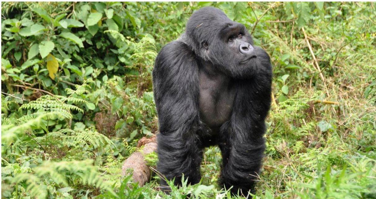
Ein Silberrücken im Bambuswald

Zurück in der Lodge treffen Sie einen Tierarzt, der auf Gorillas spezialisiert ist.