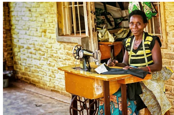
Schneiderin in Kigali