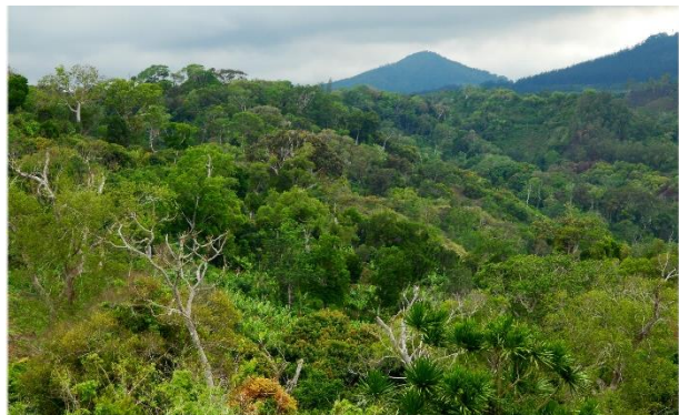
«Montagne d'Ambre»