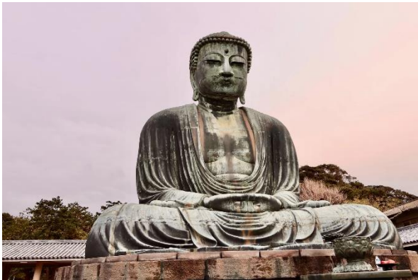
Kamakura Grosser Buddha

Nach einer Pause im Hotel lernen wir Tokio bei Nacht kennen. Denn kurz vor Einbruch der Dunkelheit fahren wir auf die Aussichtsetage der Präfekturverwaltung in Shinjuku und erleben von oben, wie die Metropole langsam erleuchtet.