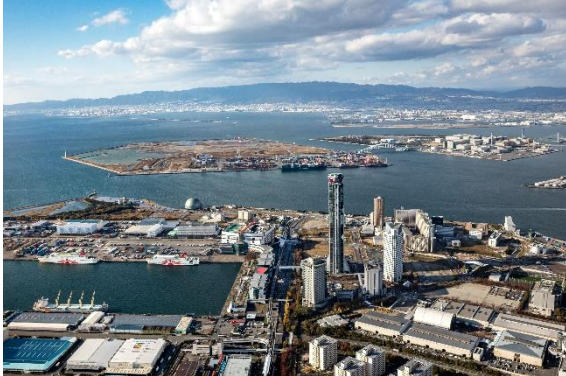
Expo-Gelände im Hintergrund

Heute ist unser zweiter Tag auf der Weltausstellung. Wer nicht an der EXPO teilnehmen möchte, kann Osaka auf eigene Faust erkunden. Am Abend treffen wir uns im lebendigen Stadtteil Dotonbori, um feine japanische Küche zu probieren, das köstliche Takoyaki.