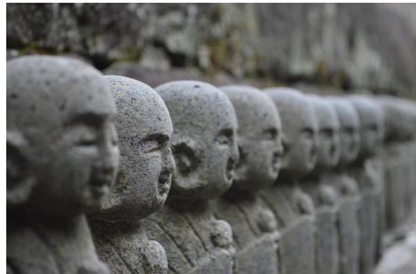
Statuen beim Hasedera Tempel