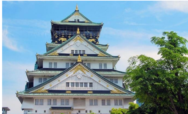
Die Burg von Osaka