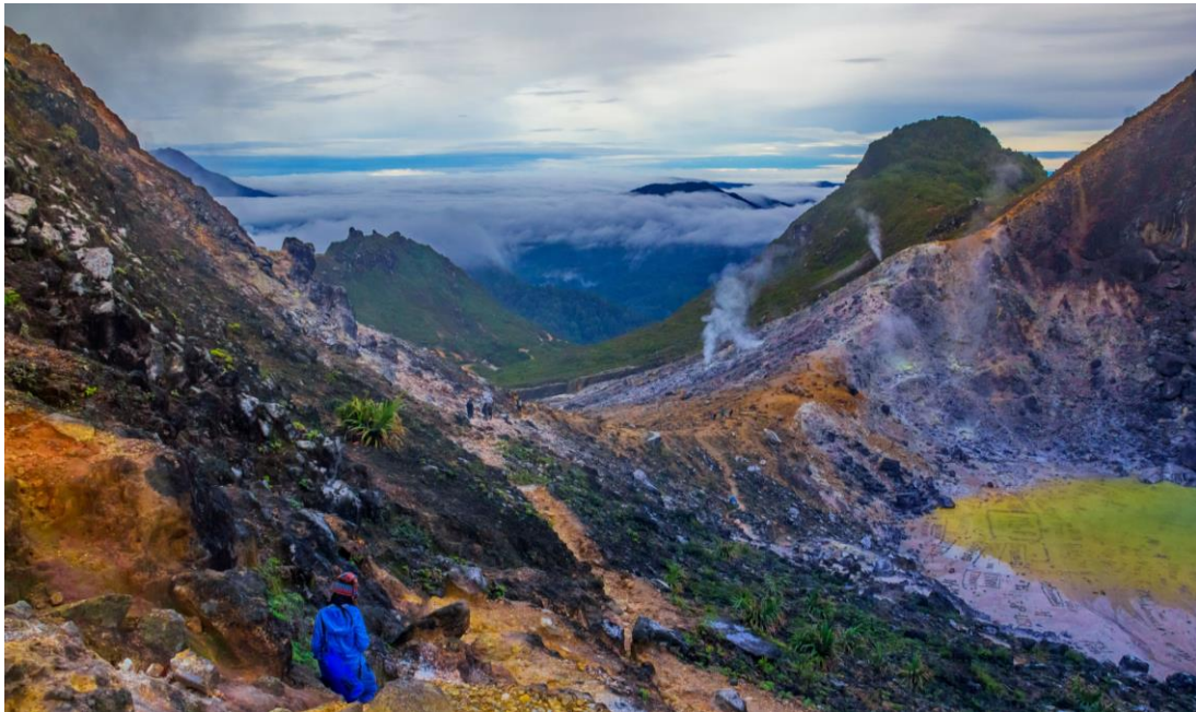
Wanderweg zum Berg Sibayak

Gehören Sie zu den Frühaufsteher*innen? Dann können Sie an diesem Tag noch vor Sonnenaufgang zum Berg Sibayak wandern. Belohnt werden Sie mit wunderschönen Panoramaaussichten bei Sonnenaufgang. Die Wanderung ist moderat und dauert zirka 5 Stunden inklusive Pausen. Zurück in der Lodge brechen wir auf in Richtung Samosir Insel. Wir überqueren mit der Fähre den Toba See, den grössten Kratersee der Welt.