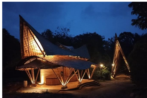
Orangutan Haven