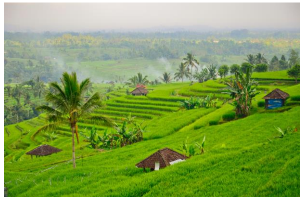
Reisterrassen von Jatiluwih