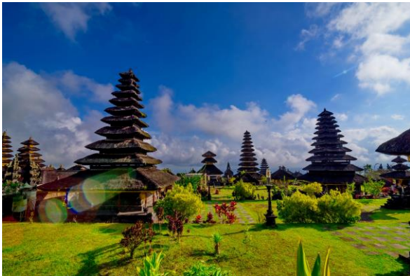
Tempelanlage Pura Taman Ayun

Wir fahren zur Tempelanlage Pura Taman Ayun (UNESCO-Weltkulturerbe). Der Weg zur Tempelanlage führt an den Reisterrassen von Jatiluwih vorbei, ebenfalls UNESCO-Weltkulturerbe. Der Anbau von Reis hat auf Bali eine lange Tradition. Reis dient hauptsächlich als Grundnahrungsmittel, wird allerdings auch als Zahlungsmittel eingesetzt und sichert vielen Balines*innen den Lebensunterhalt. Bei einem Abschiedsessen lassen wir die Reise Revue passieren und freuen wir uns auf die Aktivitäten am nächsten Tag.