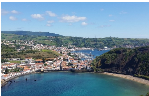
Die Bucht in Horta

Am Morgen besuchen Sie mehrere landestypische Dörfer und machen einen Halt am See Lagoa do Capitão. Nach dem Mittagessen besichtigen Sie die Kirche São Mateus und die Weinberge (UNESCO-Weltkulturerbe), in denen der «Verdelho» angebaut wird, eine traditionelle Rebsorte der Azoren, insbesondere auf Pico. Anschliessend besuchen Sie das Weinmuseum, wo eine kleine Weinverkostung auf Sie wartet. Mit der Fähre gelangen Sie auf die Insel Faial, die für ihre blau blühenden Hortensien und den grossen Jachthafen in Horta bekannt ist. Sie werden ins Hotel Azoris Faial gebracht, wo Sie übernachten werden.