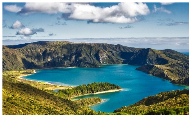
Lagoa da Fogo