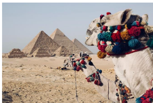
Pyramiden von Gizeh