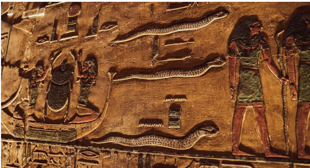
Tal der Könige