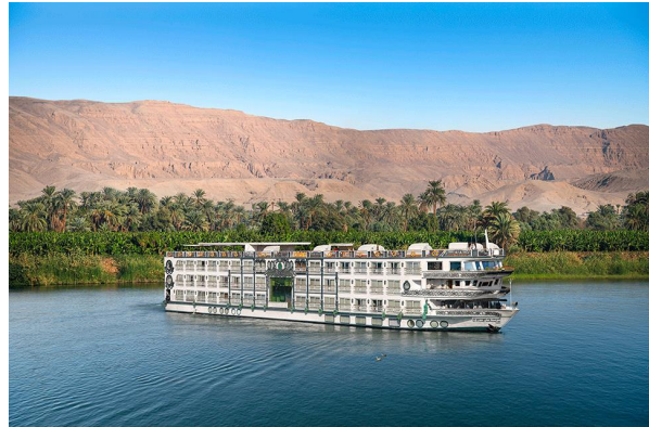
«Sonesta St. George»