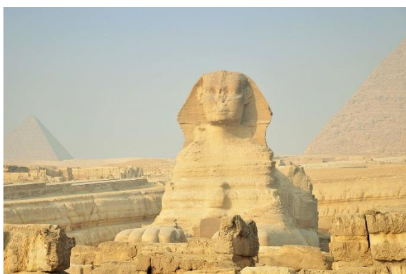
Grosse Sphinx von Gizeh

Heute tauchen Sie zum ersten Mal ins alte Ägypten ein. Sie besichtigen die weltberühmten Pyramiden von Gizeh sowie die Sphinx und erkunden Memphis und Sakkara. Zum Abschluss bewundern Sie die riesige Statue von Ramses II. Oskar Kaelin führt Sie in die wichtigsten archäologischen Entdeckungen und in die spannende Geschichte der Pharao-Kulturen ein.