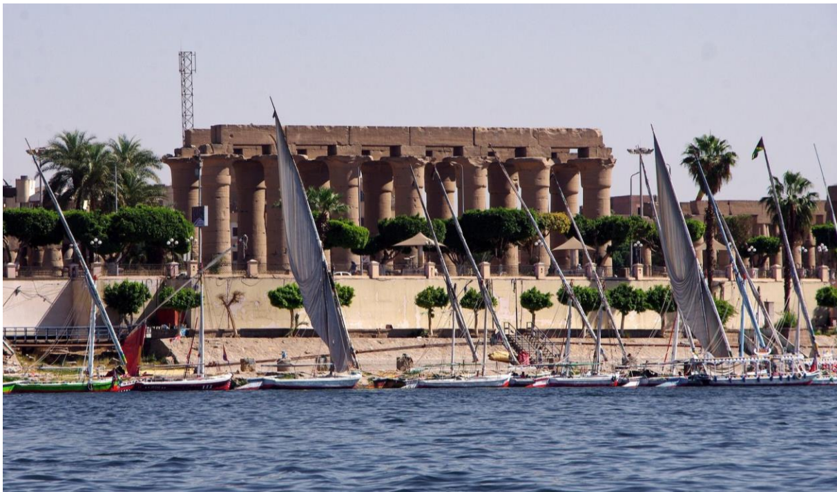
Das geschichtsträchtige Luxor bietet Ihnen eine Zeitreise in das Alte Ägypten

Der Tag steht Ihnen zur freien Verfügung. Schlendern Sie durch die Stadt, besuchen Sie eins der spannenden Museen oder entspannen Sie sich im Hotel.