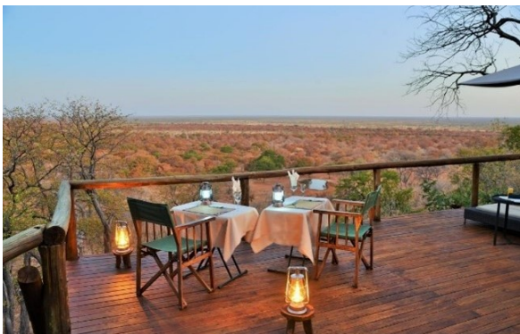
Ghoha Hills Savuti Lodge

In den nächsten zwei Tagen erleben wir den Park während Pirschfahrten, welche oft spektakuläre Sichtungen ermöglichen. Die Tiere versammeln sich an den Flussläufen und Wasserlöchern. Elefanten, Büffeln, Impalas, Kudus, Giraffen, Zebras, Antilopen, Hyänen, sowie Löwen und Leoparden sind einige der möglichen Begegnungen in der Umgebung. Unser Aufenthalt wird neben den Pirschfahrten durch verschiedene Aktivitäten bereichert, wie der am Nachmittag servierte High Tea mit hausgemachtem Kuchen oder einer Sundowner-Fahrt mit Apéro und Blick auf das von Tieren besuchte Wasserloch.