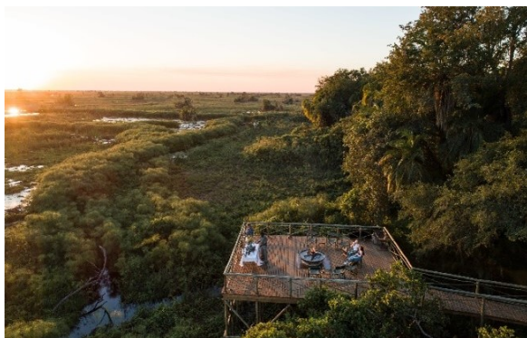
Setari Camp

Am Morgen und am Nachmittag unternehmen wir Bootsfahrten auf dem Okavango. Das Okavango Delta ist das grösste Binnendelta der Welt und mit seinem Labyrinth aus Lagunen, grossen Seen und sich schlängelnden Wasserwegen ein wahres Naturparadies. Wir geniessen das Delta, das von einer Vielzahl von Vögeln und Wildtieren bewohnt wird, welche in diesem aussergewöhnlichen Ökosystem einzigartig sind. Vogelbeobachtende finden hier eine grosse Anzahl von Zugvögeln, Wasservögeln und Greifvögeln.