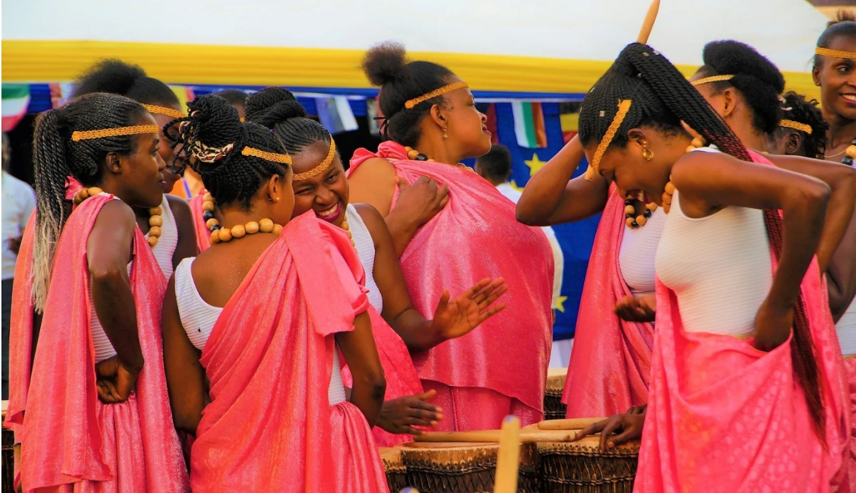
Ingoma Nshya

Dies zeigt den starken Willen der ruandischen Frauen, ihr Land voranzubringen und wieder zu vereinigen. Wir erhalten von der Gruppe Trommel- und Tanzlektionen, bevor wir an einer kleinen Aufführung teilnehmen. Auf der Weiterfahrt besuchen wir den Königspalast in Nyanza. Am Abend treffen wir in Kigali ein.