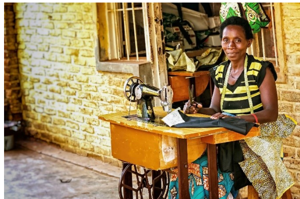
Schneiderin in Kigali