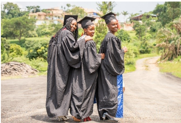
Studentinnen nach dem Abschluss