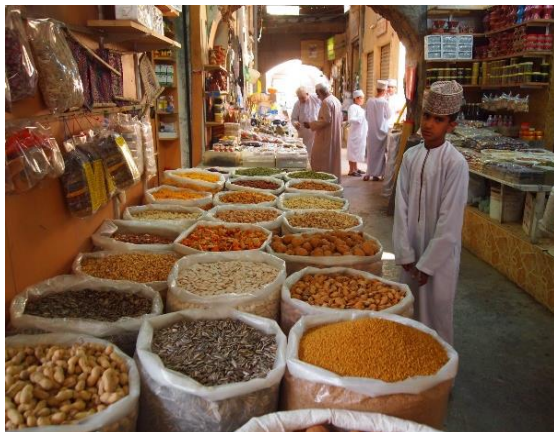
Markt in Muscat