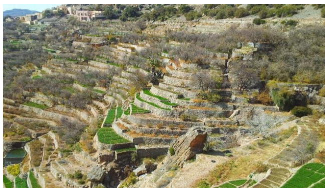
Saiq Plateau des Jabal Akhdar Gebirge