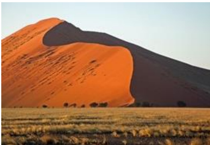
Die eindrücklichen Dünen von Sossusvlei

Heute erleben wir ein Naturphänomen nach dem anderen. Wir schauen uns die Sanddünen von Sossusvlei genauer an. Sie gehören zu den ältesten und höchsten Dünen der Welt und wurden zum UNESCO Weltnaturerbe ernannt. Als nächstes besuchen wir das Dead Vlei, welches mit seinen toten Karmeldornbäumen beeindruckt. Die schon vor Hunderten Jahren vertrockneten Baumstämme wurden in der Wüste richtiggehend konserviert und bilden heute skurrile Fotosujets. Zum Abschluss besichtigen wir den imposanten Sesriem Canyon, der bis zu 30 m tief ist.