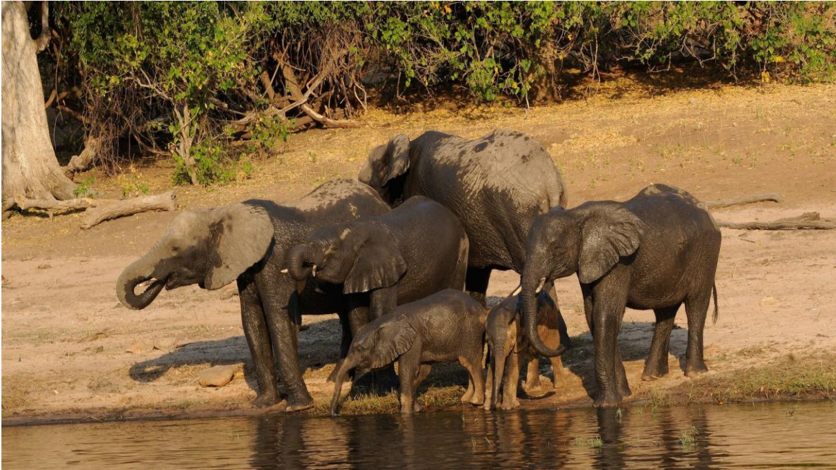
Elefanten am Chobe Fluss

Nach einer frühen Pirschfahrt geniessen wir am Nachmittag eine Bootsfahrt auf dem Chobe Fluss. Die gemütliche Fahrt bietet besonders gute Gelegenheiten, um grosse Elefantenherden beim Trinken beobachten zu können.