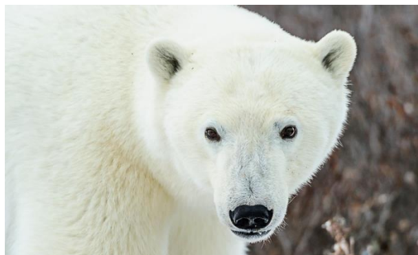
Eisbär ganz nah