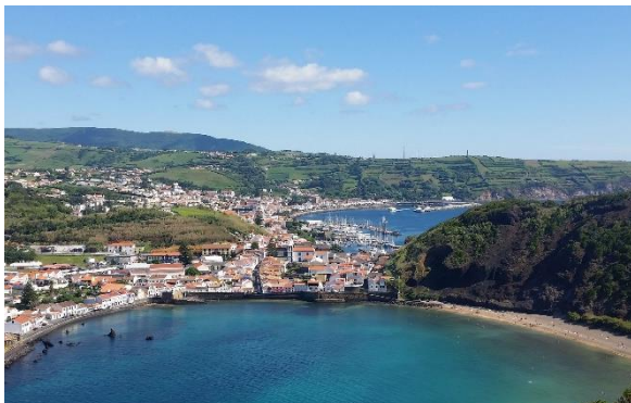
Die Bucht in Horta

Mit der Fähre gelangen Sie auf die Insel Faial, welche für ihre blau blühenden Hortensien und den grossen Jachthafen in Horta bekannt ist. Sie werden ins Hotel Azoris Faial gebracht, wo Sie übernachten werden. Am Nachmittag unternehmen Sie eine Stadtführung durch das quirlige Horta und kehren im weltberühmten Peter Café Sport ein.