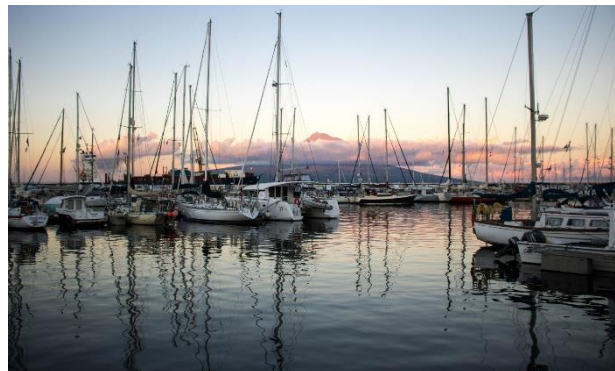
Der Yachthafen von Horta