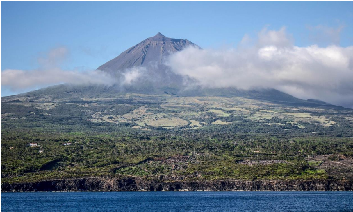
Aussicht auf den Vulkan auf der Insel Pico

Gerne organisieren wir für Sie ein individuelles Vor-/Nachprogramm.