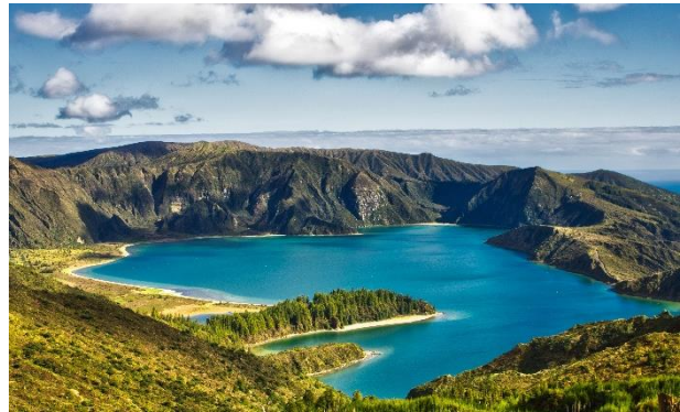
Lagoa da Fogo